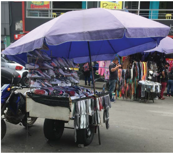
Figura 5. Ejemplo de una carreta

Las carretas son otra de las formas de estructura de los negocios. Implican una mayor carga por el desplazamiento itinerante que realizan los vendedores buscando llegar a sus compradores en distintas áreas y puntos del municipio de Soacha. En este sistema, al igual que en los de tendido en el piso, vitrina y mesa, se tiene mayor exposición al medioambiente, lo cual afecta negativamente su salud. El porcentaje de estas condiciones llega al 43 %, como se observa en la tabla 4.