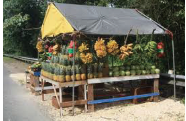
Figura 4. Ejemplo de una caseta de ventas en espacio público