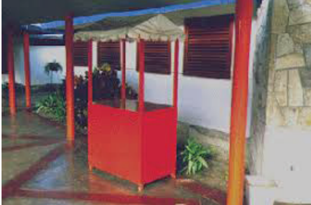
Figura 3. Caseta de ventas ambulantes