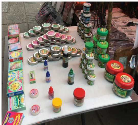
Figura 7. Ejemplo de mesa en el espacio público