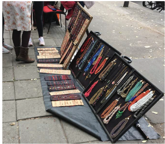
Figura 6. Ejemplo de ventas en suelo