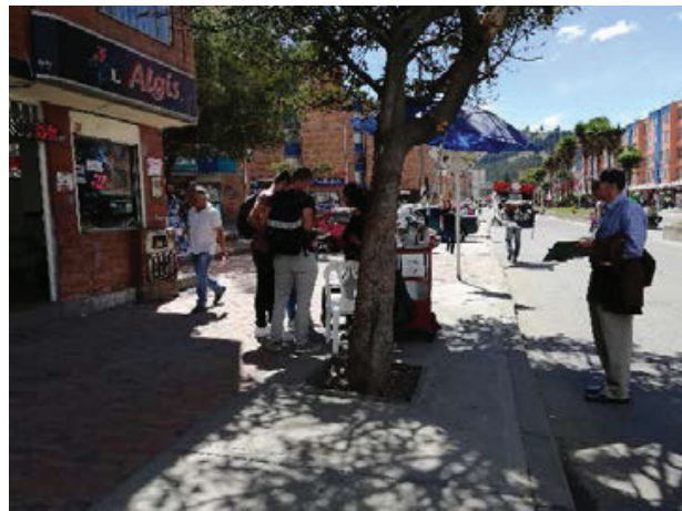
Figura 9. Tipos de puestos ambulantes en San Mateo en Calle