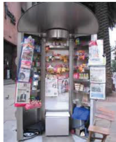
Figura 2. Ejemplo de un quiosco de ventas en espacio público Bogotá