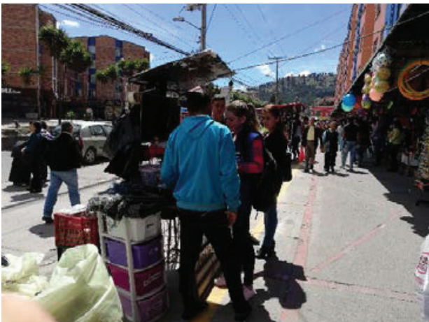
Figura 8. Tipos de puestos ambulantes en San Mateo

sus mercancías en la casa o en bodegas. Para muchos ambulantes los desplazamientos son significativos en distancia y peso, lo cual aumenta el desgaste y la carga física. Con relación a esto, la tabla 5 muestra que el sitio donde se guardan las mercancías y el porcentaje de uso en la muestra de vendedores ambulantes.