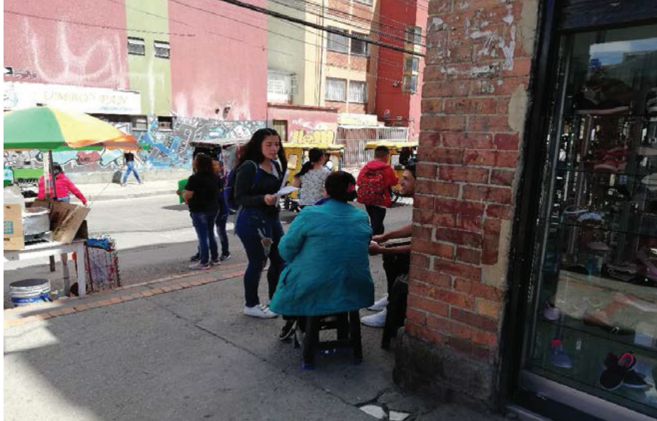
Figura 10. Puestos ambulantes en San Mateo, Soacha