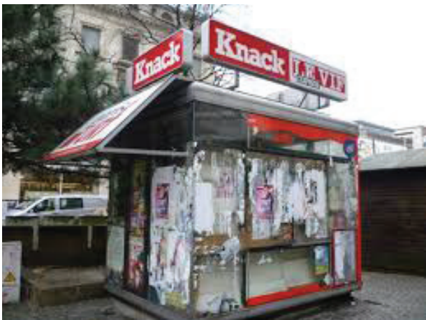
Figura 1. Ejemplo de un quiosco de ventas en espacio público urbano

de las zonas rurales, dentro del fenómeno denominado reclutamiento forzado, donde se exigía a cada familia un porcentaje de sus hijos adolescentes para la guerrilla. Quien no cumplía podía verse afectado incluso con la pena capital (Ridon, Jean-Xavier, 1997). Sumadas estas dos condiciones generan el 16 % de la caracterización poblacional (víctimas y victimarios).